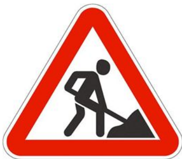
Проф- и эковредности