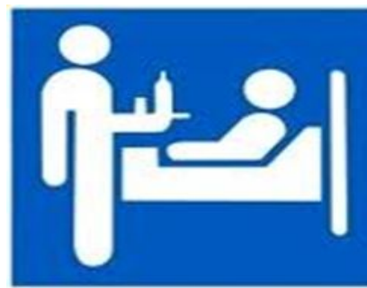
взрослые и дети с хроническими болезнями в стадии ремиссии, реконвалесценты после острых заболеваний